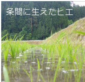
条間に生えたヒエ

ノビエ等の雑草は代かき終了後から活動し、代かき～田植えの期間も高温で推移するため、成長も早くなります。