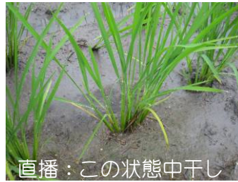
直播：この状態中干し

□ 移植コシの場合 □ 1株の茎数は見た目よりも多くなっています。 左の株の状態です。18本/株になります。