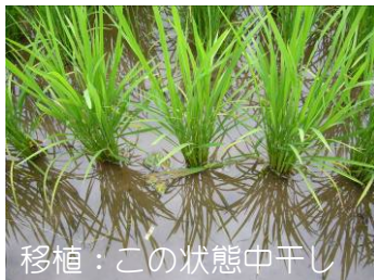
移植：この状態中干し

又、中干しは無効分げつを抑制し、下方向への根の伸張を促進するため必要な作業であることを再認識して、適期に実施してください。