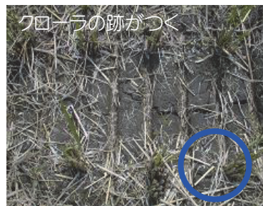
適正管理した圃場

平年値は7月下旬～8月上旬に気温のピークを迎え、その後平均気温が下がっていますが、近年9月中旬でも27℃を上回る日があることから、 収穫直前(刈取2日～3日前)までの間断通水を徹底するようにしてください。