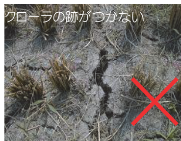
早期落水した圃場