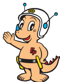
福井県警マスコット リュウピー